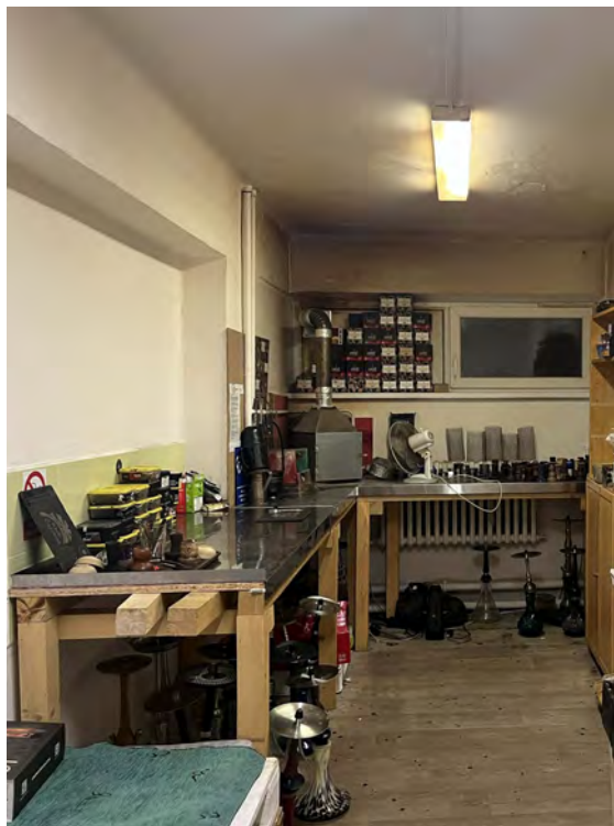
Obrázek č. 3 – dýmková kuchyňka