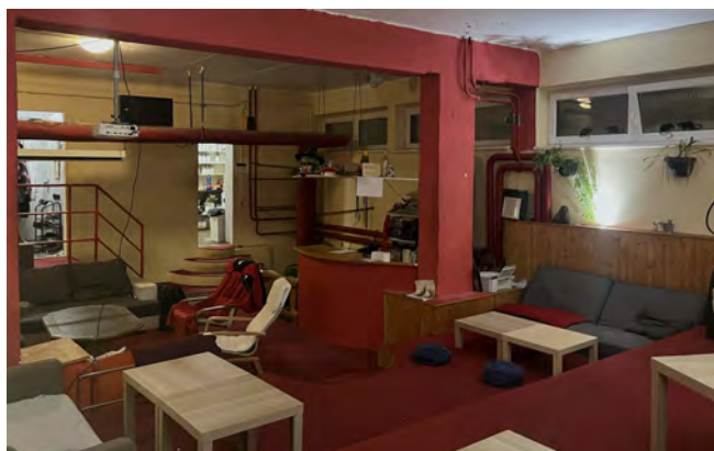
Obrázek č. 2 – prostor pro příznivce