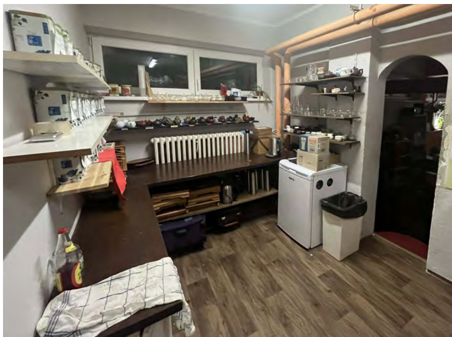
Obrázek č. 4 – čajová kuchyňka