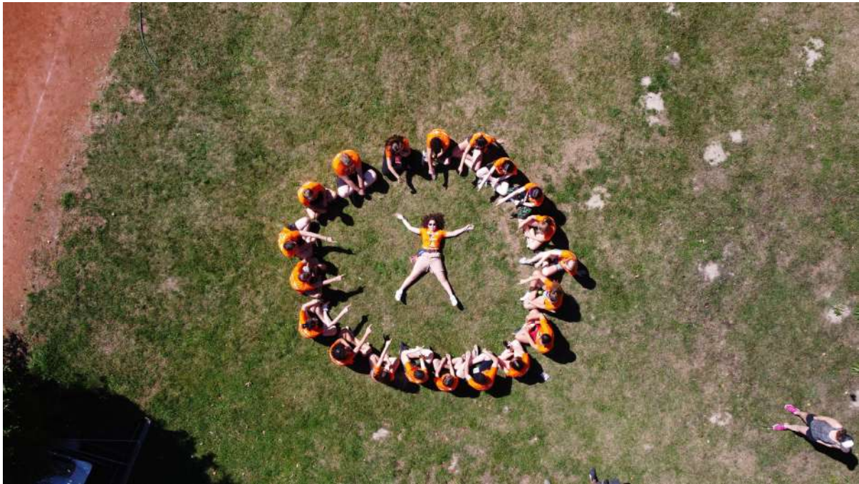
Obrázek 2 - studenti