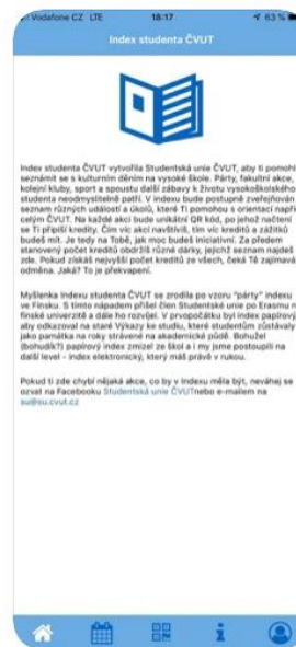
Obrázky č. 2: Informace o umístění QR kódů z namátkové akce Obrázek č. 3: Ukázka informací z App Store