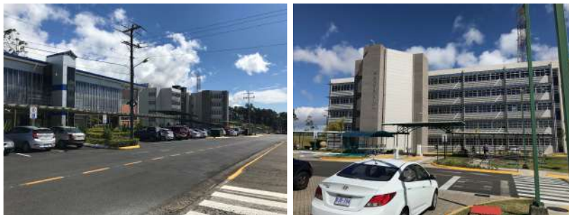
Obrázek 2: Pohled na kampus

Velmi dobrá, ale bohužel jsem moc nestihl využít.