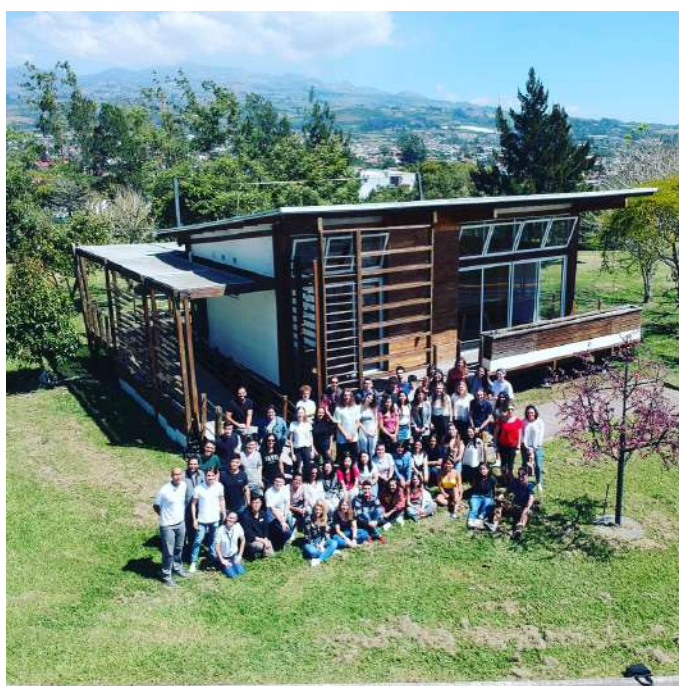
Obrázek 1: Naše mezinárodní skupina studentů