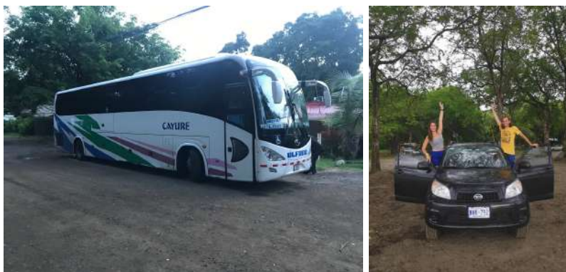
Obrázek 5: Transport na Costa Rica