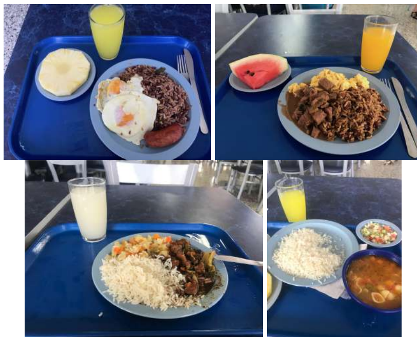
Obrázek 4: Snídaně/oběd/večeře v kampusu