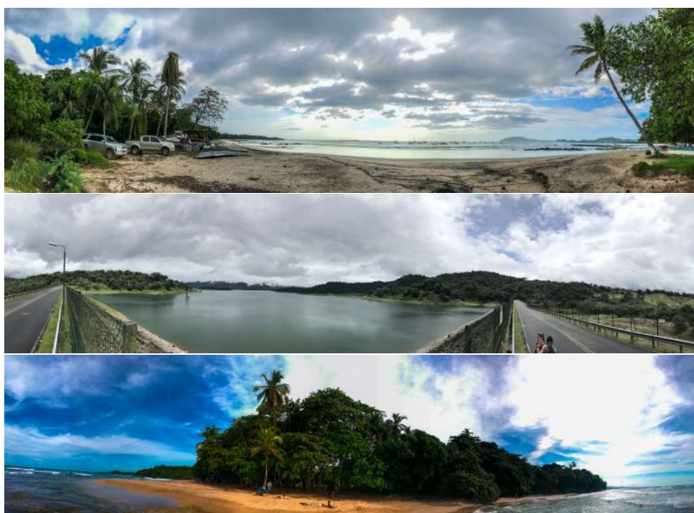
Obrázek 7: Vybrané fotografie