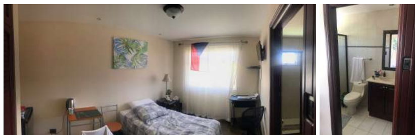
Obrázek 3: Moje ubytování

V soukromé rezidenci. Trochu mne zpětně trochu naštvalo, že univerzita posílá nabídku na ubytování, které je o poznání dražší než je možné normálně sehnat.