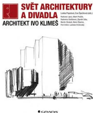
Obr. 3. Obálka knihy Svět architektury a divadla. Architekt Ivo Klimeš s projektem ostravské filharmonie.

Obecné závěry o dění v šedesátých letech, které kniha přinesla, se víceméně shodují s tím, co prokázaly už předchozí výzkumy; obohacením jsou informace o specifičnosti vývoje divadelních staveb, působení „mimoarchitektonických vlivů“ na vývoj divadelní typologie, přičemž je zřejmé, že pro vývoj divadelní typologie byla tato doba přelomová, a to nejen u nás, ale i na Západě. Kniha popisuje, jak až krkolomně se popudy z inscenační praxe na přelomu padesátých a šedesátých let, jejichž cílem bylo pracovat ve flexibilním a variabilním divadelním prostoru, střetávaly s realitou socialistického plánování, a shrnuje nesmírný význam soutěží v rozvoji divadelní typologie. Ta u nás, zejména v soutěžních návrzích, ve sledovaném období dosáhla výsledků srovnatelných se zahraničím. Realizace Iva Klimeše prověřily limity i možnosti tehdejší výstavby divadel u nás (zejména strojní zařízení bylo nutno zajišťovat v zahraničí).